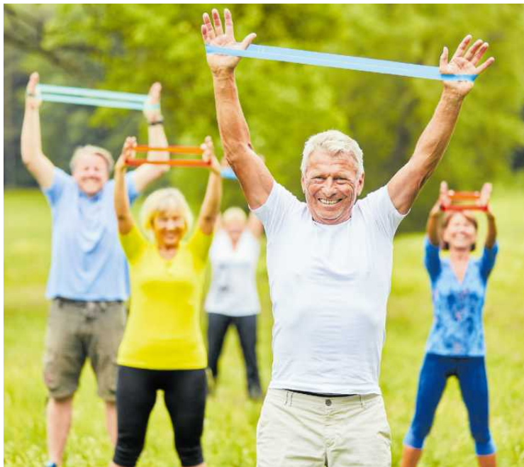
• Seniorzy mogą bezpłatnie korzystać m.in. z zajęć ruchowych

Lęborski Uniwersytet Trzeciego Wieku Adres: ul. Bolesława Krzywoustego 1, 84-300 Lębork. Kontakt: 59 843 46 08. Co proponuje UTW? Zajęcia sportowo-rekreacyjne oraz warsztaty