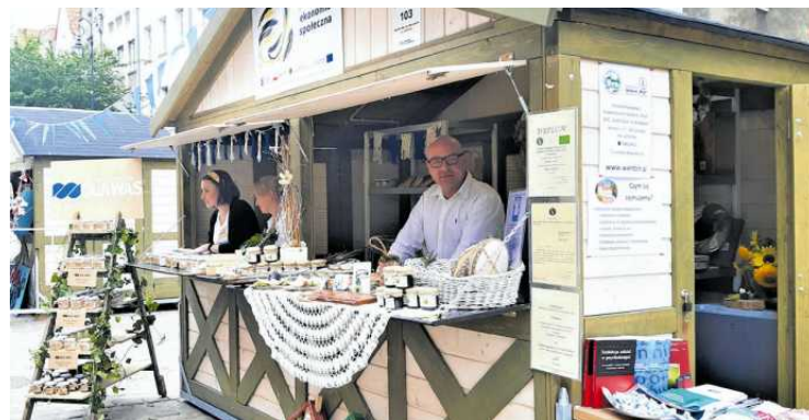
• Stoiska przedsiębiorstw społecznych z Pomorza: Fundacji dla Was z Rumi i Stowarzyszenia Solidarni „Plus” z Wandzina

Z kolei „Dobre Miejsce”, założone przez Parafię Św. Mikołaja w Gdyni, sprzedawało domowe, świeże zapiekanki z najwyższej jakości produktów, m.in. w wersji wiosennej, serowo-szpinakowej oraz mięsnej.